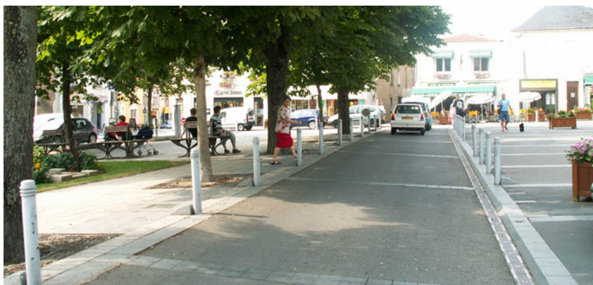
Vertou, les marronniers de la place de la mairie

Le cas de fossés de plantation réduites est aussi une raison de moins bonne stabilité au vent, puisque les arbres ne sont pas alors suffisamment ancrés.