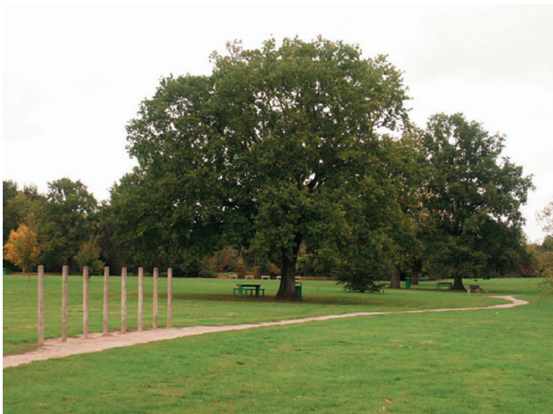
chênes pédonculés dans un espace vert à Sainte-Luce-sur-Loire

D'une façon générale, il y a lieu de se poser la question de la place de l'arbre dans les espaces publics: