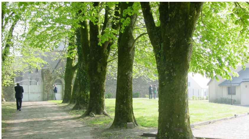
une place de village dans le Morbihan (Caden)

Un arbre n'est pas «éternel», c'est un être vivant qui grandit, qui vieillit et qui meurt. Il est nécessaire de reconnaître les signes de vieillissement pour savoir remplacer et renouveler une trame arborée.