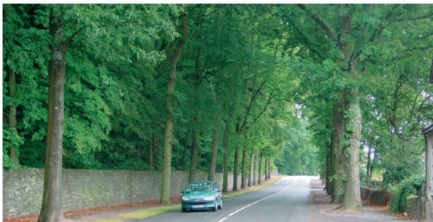
un alignement de chênes en entrée de bourg, à Nozay