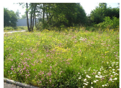
Un fleurissement spontané, naturel La Chapelle-sur-Erdre