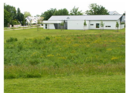
Bassin d'orage traité en prairie (fauchée 1 fois/an) La Chapelle-sur-Erdre

Puis selon le classement des espaces verts, y est appliqué un entretien différent (différent par l'utilisation des produits phytosanitaires, le fleurissement à produire, la fréquence des tontes, etc...).