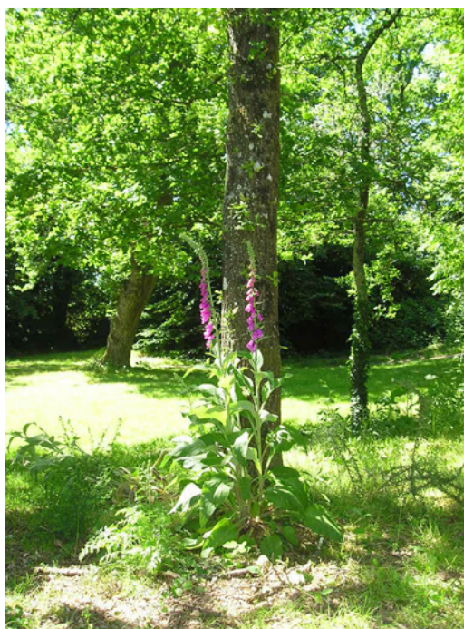
Les pieds d'arbres ne sont plus désherbés. La flore locale se réinstalle et offre un fleurissement spontané. La Chapelle-sur-Erdre