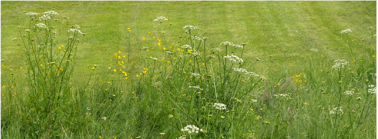
La différence de tonte est voulue de façon à conserver un aspect «entretenu» là où on peut accéder, et à laisser se développer parallèlement la prairie

La gestion différenciée des espaces verts est un thème de plus en plus décrit, discuté, expérimenté.